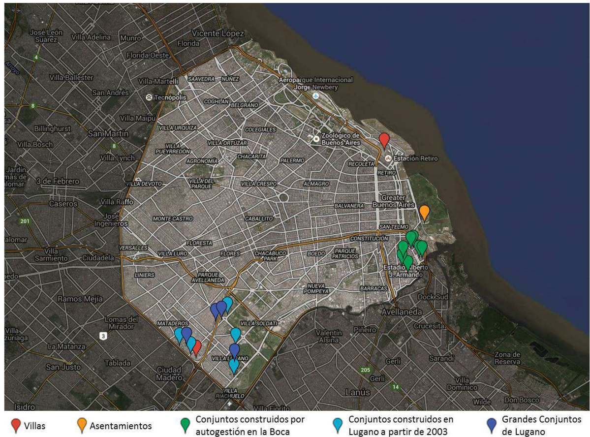
Mapa 2 Localización intraurbana de los casos analizados