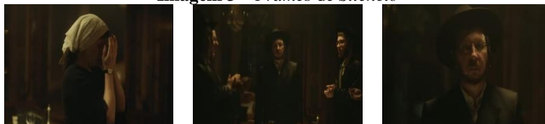
Imagem 3 – Frames de Silêncio

avançar a cena, “criando uma nova ideia baseada na justaposição de duas imagens” (VAN SIJLL, 2017, p. 144), é possível perceber que o gesto ocorre diante de cinco homens, supostamente judaicos. A cena sugere submissão da mulher, um ritual, um gesto espontâneo.