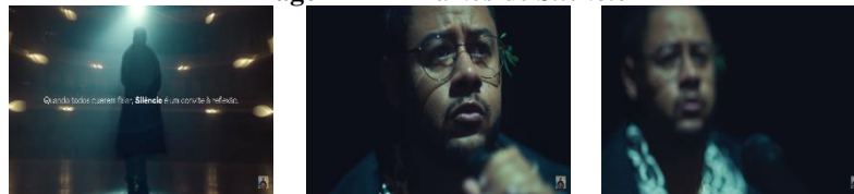
Imagem 11 – Frames de Silêncio

Um corte, coincidente com o fim do som externo “não diegético 10 ”, nos termos de Van Sijll (2017, p. 121), encaminha para última cena (Imagem 11), com dezenove segundos. Nela, o cantor Emicida é visto de frente a uma suposta plateia. Na tela, aparece a frase: “Quando todos querem falar, Silêncio é um convite à reflexão”. A palavra “silêncio” aparece em destaque, seja por alusão ao álbum “AmarElo”, seja simplesmente para reforçar a importância dessa atitude. O cantor fixa o olhar como se fosse em direção ao público. O show termina, e um fade-out faz com que sua imagem desapareça lentamente. Diferente dos personagens em destaque nas outras nove cenas, o cantor não fita o olhar na direção da câmera/espectador, como se o seu show fosse para exibir a mensagem do seu público, não a dele.