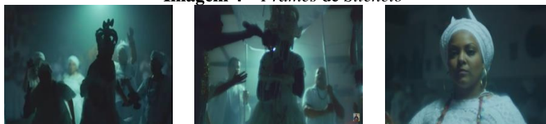
Imagem 4 – Frames de Silêncio

A ideia de religiosidade também é percebida na próxima cena (Imagem 4), de dezesseis segundos. No entanto, são mulheres que demonstram ter domínio do evento, marcado por danças/celebrações. A cena remete às culturas de matriz africana, e um contra-plongê exhibe o olhar em primeiro plano de uma das integrantes por alguns segundos, supostamente indicando sua superioridade, já que esse recurso “transmite força ao objeto fazendo-o parecer dominar o que está abaixo dele” (VAN SIJLL, 2017, p. 200).