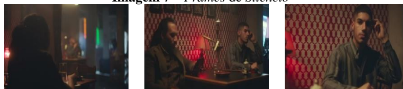
Imagem 7 – Frames de Silêncio

Um novo corte leva a câmera a passear em travelling por vinte segundos em outro ambiente (Imagem 7). Inicialmente desfocada, a imagem mostra pelo menos dois homens em um local de luminosidade baixa, provavelmente uma casa noturna/diversão ou de jogos de azar.