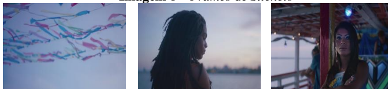
Imagem 6 – Frames de Silêncio

A expressão facial dela sugere deslocamento, como se o ambiente de festa não lhe fizesse sentido. Em ambos os casos, chama a atenção o contraste de figurino, notadamente marcado e evidenciado nos planos detalhes, pelo uso de roupas, acessórios e caracterizações que “sutil ou mais óbvio”, seja para “indicar semelhança, diferença, ironia, desconforto, pobreza ou riqueza” ou até mesmo “profissões” (VAN SIJLL, 2017, p. 276).