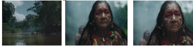
Imagem 5 – Frames de Silêncio