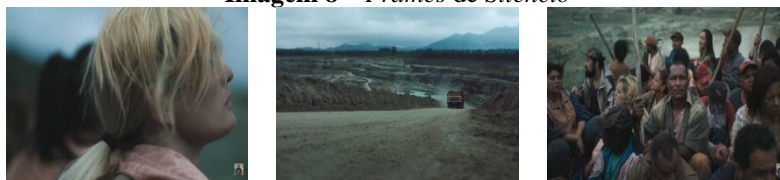
Imagem 8 – Frames de Silêncio

Diferentemente da anterior, a cena seguinte, de quatorze segundos (Imagem 8) denuncia um ambiente provável de trabalho. O foco recai sobre uma mulher branca, cabelos loiros, vista lateralmente, olhando para o “nada”. A câmera em tilt leva o espectador a “sentir” o trajeto vivenciado pela personagem que, na carroceria de um caminhão, aparece ao lado de eventuais trabalhadores, posto que portam instrumentos de trabalho braçal, e de um homem que mira a câmera – ainda em tilt .