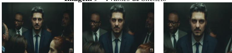
Imagem 9 – Frames de Silêncio

que podem ser vistas no enquadramento) é preta. Um zoom-in , sem cortes, recai sobre um homem branco, de aparência jovem, cabelo e barba bem alinhados, que olha fixamente em direção à câmera, sério. É a primeira cena que remete à ideia de requinte e elegância, características normalmente associadas às pessoas de classe econômica mais elevada.