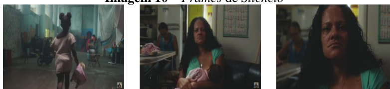
Imagem 10 – Frames de Silêncio

Avançando para a cena (Imagem 10) mais longa do videoclipe , com cinquenta e oito segundos. Em um local precário, com casas simples, provavelmente ocupadas por pessoas de classe social baixa, uma criança de cor preta surge correndo em um beco e passando por escadarias. A criança percorre o trajeto carregando uma boneca, ocasião em que é possível vislumbrar desgaste nas paredes, móveis simples, práticas simplórias etc. O penteado de cabelo e o vestido que ela usa são semelhantes ao da boneca que carrega nas mãos, mas com uma distinção notória: a boneca é branca do cabelo loiro. Vista inicialmente em plongê , em seguida uma steadicam , uma câmera de mão, porém com uma imagem bem mais estável e baixa oscilação (VAN SIJLL, 2017, p. 230) a acompanha pelo trajeto.