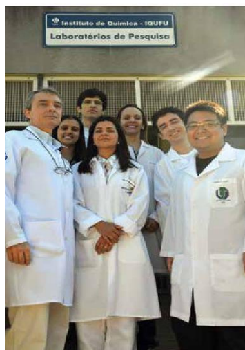
Equipe conta com profissionais de diferentes formações, nas áreas de Ciências Biológicas e Exatas

Além do texto escrito, a revista também traz algumas imagens que demonstram o trabalho entre os membros do laboratório, conforme exemplificado na Figura 1.